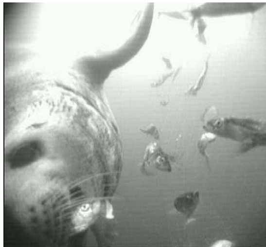
Roņi pie zvejas rīkiem (Foto: Sara Königson, Zviedrija, 2007)