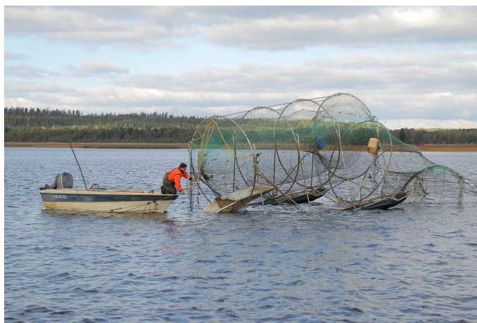
Roņu droša murda āmja izcelšana Somijas piekrastē

Zviedrijā 2003. gadā uz dažiem gadiem, nevar būt pastāvīgs problēmas risinājums. Vienīgais efektīvais veids, kā roņus atturēt no lomu un rīku postīšanas, saglabājot zvejas iespējas roņu uzturēšanās rajonos, šobrīd ir meklējams speciālos tehniskos līdzekļos.