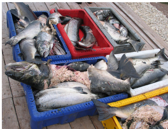
Roņu sapostītais lašu loms Latvijas piekrastē

Aprēķināts, ka jau 1997. gadā, kad roņu populācija vēl nebija strauji pieaugusi, zaudējumi Zviedrijas piekrastes zvejā jau sasniedza 15-20% (jeb 6 milj. eiro) no kopējās piekrastes nozvejas vērtības. Filmēšana ar zemūdens videokamerām rāda, ka viens roņis dienā patērē līdz 12 kg zivju.