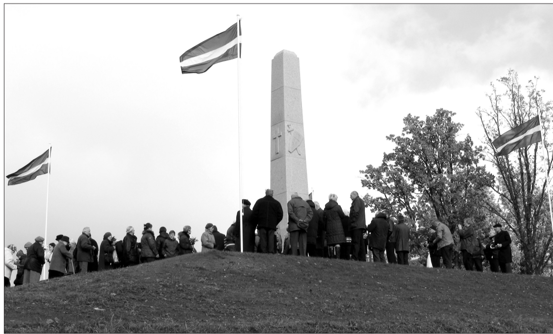
Lāčplēša dienā arī pie 7. Siguldas kājnieku pulka pieminekļa Alūksnē un citviet novadā godinām tos Latvijas armijas karavīrus, kas brīvības cīņās nosargāja jaunās Latvijas valsts neatkarību

Šobrīd strādājam pie nākamā gada pašvaldības budžeta. Pagaidām konkrēti nezinām, kādi varētu būt ieņēmumi, taču pagastu pārvaldes un citas pašvaldības iestādes savus budžeta projektus ir iesniegušas. Skaidrs, ka sociālā joma un izglītība būs prioritātes. Es aicinu iedzīvotājus sniegt pašvaldībai konstruktīvus, uz attīstību vērstus priekšlikumus, kā veicināt novada attīstību un domāt par cilvēkiem, ne par personīgām ambīcijām.