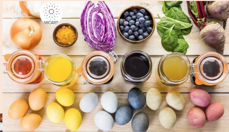
Lieldienu olu krāsošana dabīgos materiālos